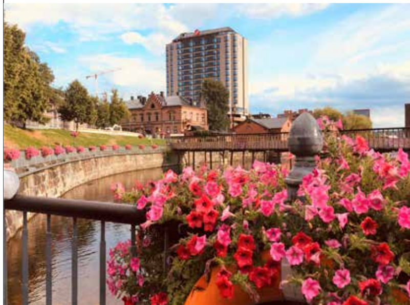
Näkymä Hämeensillalta Ilveksen suuntaan.

Illtakävelyä ja terassielämää, lapsille Sorin aukion leikkipuisto. Saunaravintola Kuuma tarjoaa ikimuistoisia elämyksiä Laukontorin rannassa. Hotellin saunat ja allasosasto ovat yöpyjien käytössä.