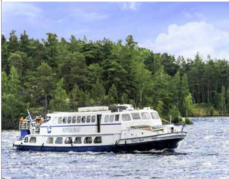
Risteilyalus m/s Silver Star.

Silver Star palaa Laukontorille klo 13. Jäljellä on vielä matkatavaroiden nouto hotellin säilöstä, ja sitten toivotammekin toisillemme hyvää kotimatkaa.