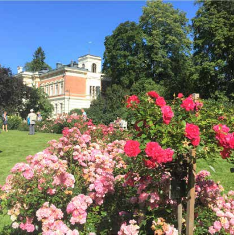
Hatanpään arboretumin ruusutarhaa.